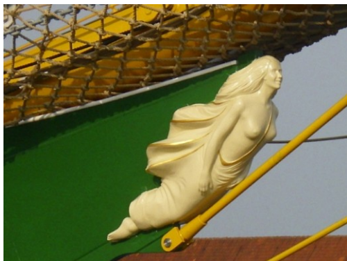
(Galionsfigur der Alexander von Humboldt II,)

Ein Musikliebhaber assoziiert in diesem Zusammenhang vielleicht das erste Rezitativ aus Bachs Kreuzstab-Kantate , bei dem die Worte "Mein Wandel auf der Welt ist einer Schifffahrt gleich..." auf „Cello-Wellen“ schwimmen. Auch bei Jahn ist das Holzschiff ein schlüssiges Symbol für eine Reise bzw. einen Übergang: Am Ende des Romans wird das Schiff gewaltsam von der Mannschaft zerstört und die etwas widerspenstige Galionsfigur, die im Folgeband als "Ellena. Das Bild aller schlafenden reglosen Menschenweiber." bezeichnet wird, muss wohl ebenfalls versinken, damit der zukünftig als Ich-Erzähler auftretende Gustav sich zu seiner Homosexualität bekennen und ein neues Leben beginnen kann.