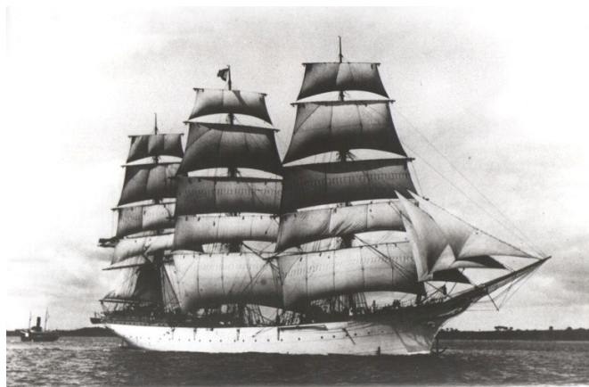
(Duchesse Anne / Großherzogin Elisabeth, Fotograf: Jean-Louis Molle)